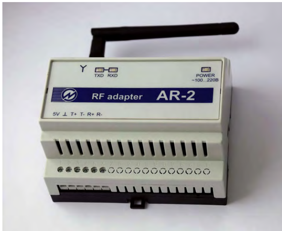
Рисунок 2.1 Адаптер AP-2 с антенной.

2.3.1 Конструктивно Адаптер AP-2 (рис. 2.1) выполнен в виде отдельного блока предназначенного для установки на DIN-рейку стандарта EN 50 022 (35 мм). Соединители выполнены в виде клемм, которые предназначены для подачи напряжения питания и подключения к приборам управления по интерфейсу RS-485.