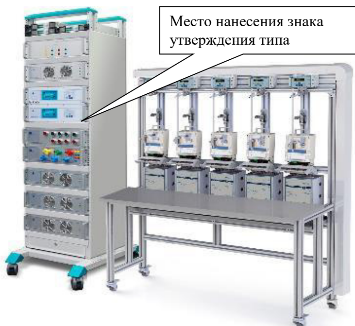
Рисунок 3 – Общий вид установок УППУ-МЭ21 С-(3.1КМ С-XX-1XX-3-0-50)-120/100-480/600-3.5-ТТ