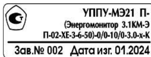
Рисунок 5 – Пример идентификационной маркировочной планки