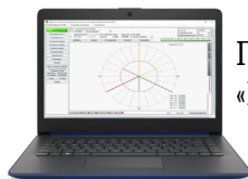
ПК с ПО «E-TransformerTest»