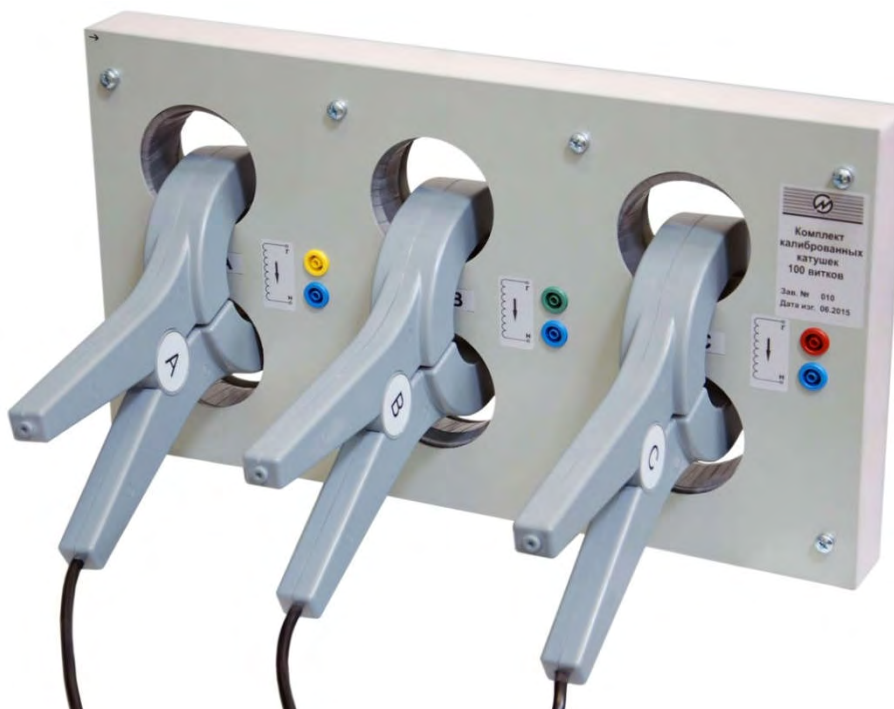
Рисунок 2.4.2 Катушка токовая калиброванная КТ-3-100

2.4.2 Катушки КТ-3-100 выполнены из провода, свитого в виде восьмерок (для уменьшения индуктивности). При использовании Катушек в составе установки УППУ-МЭ 3.1КМ-С сила тока в катушке должна быть не более 10 А. Внешний вид этих катушек с подключенными токоизмерительными клещами приведен на рисунке 2.4.2.