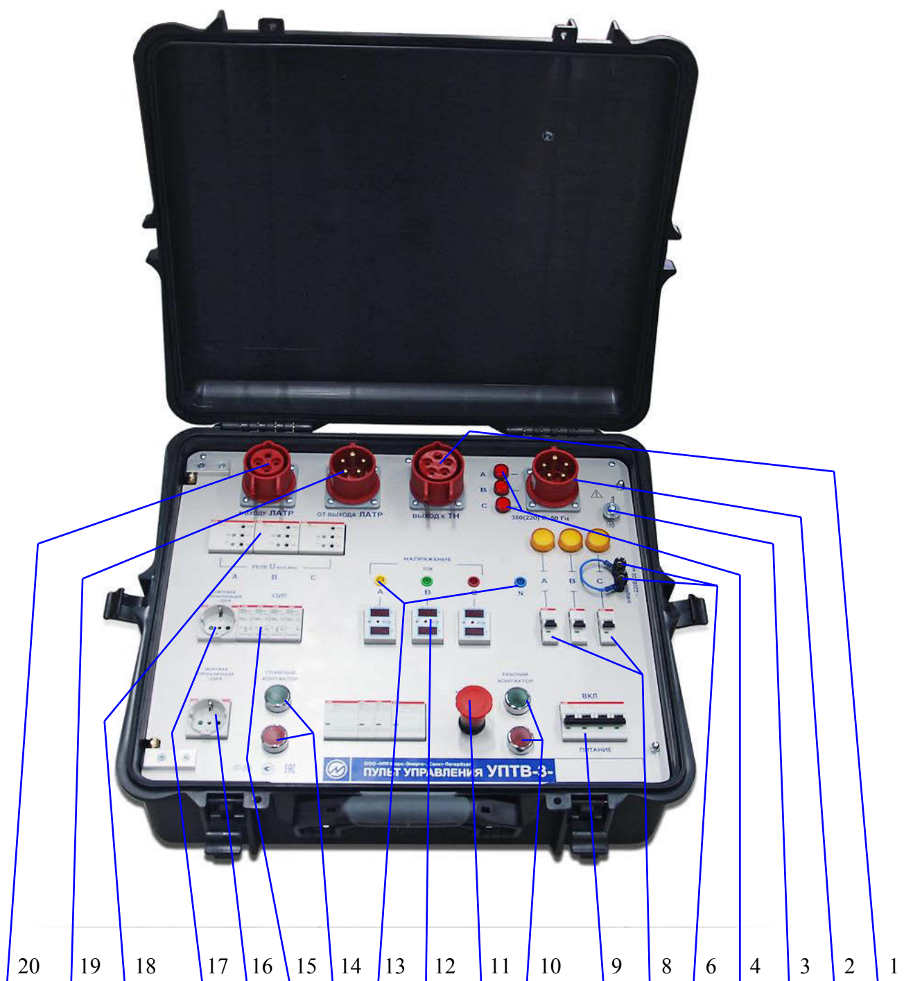
Рис. 1. Внешний вид лицевой панели ПУ:

1 — розетка для подключения кабеля от блока нагрузочных ТН; 2 — вилка для подключения кабеля питания; 3 — клемма защитного заземления; 4 — индикаторные лампы наличия фазных напряжений на вилке питания; 6 — клеммы для подключения блокировки дверей; 8 — однополюсные автоматические выключатели питания по каждой фазе с индикаторами включения; 9 — автоматический выключатель для включения питания установки; 10 — пара кнопок ГЛАВНЫЙ КОНТАКТОР (зеленая подсветка — кнопка включения, красная подсветка — кнопка выключения); 11 — кнопка аварийного отключения; 12 — вольтамперметр (по каждой фазе); 13 — гнезда для контроля параметров выходного напряжения ПУ; 14 — пара кнопок РАБОЧИЙ КОНТАКТОР (зеленая подсветка — кнопка включения, красная подсветка — кнопка выключения); 15 — устройство защиты от импульсных перенапряжений УЗИП; 16 — розетка для подключения звуковой сигнализации ограждения; 17 — розетка для подключения световой сигнализации ограждения; 18 — реле максимального напряжения RHV (по каждой фазе); 19 и 20 — розетки для подключения блока ЛАТР