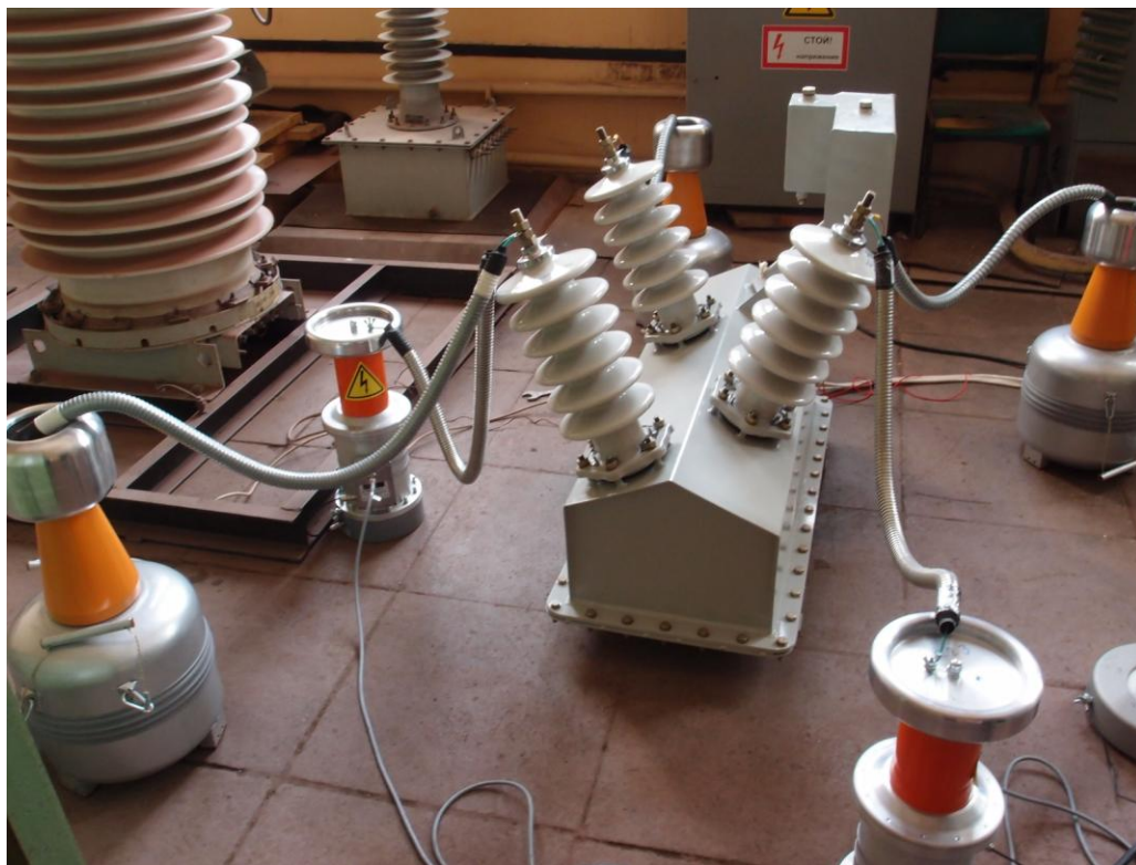
Рис.4. Испытания УПТВ-3-35 (показана только высоковольтная часть).

Данная схема успешно прошла испытания на заводе-изготовителе трансформаторов ОАО «РЭТЗ Энергия» в г. Раменское (рисунок 4). Измеренные на УПТВ погрешности ТН незначительно отличались от погрешностей, полученных на заводской установке (до 0,02% по модулю и до 0,4 мин по углу).