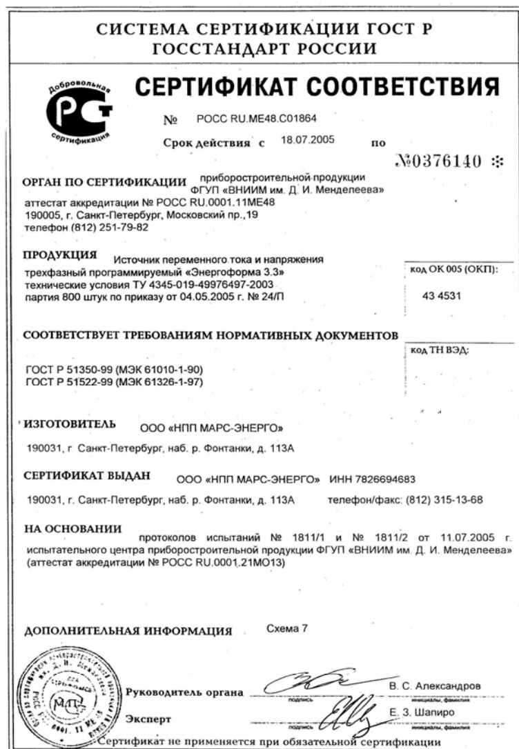
Рис. 2.1. Сертификат соответствия требованиям безопасности и ЭМС Источника «Энергоформа 3.3»

Источник имеет сертификат соответствия требованиям безопасности и ЭМС № РОСС RU.МЕ48.С01864 (см. рис. 2.1) от 18.07.2005.