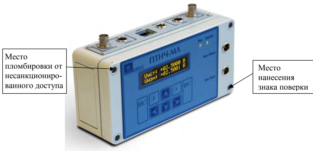
Рисунок 2 - Общий вид Приборов модификаций ПТНЧ-МЛ, место пломбировки от несанкционированного доступа и обозначение места нанесения знака поверки.