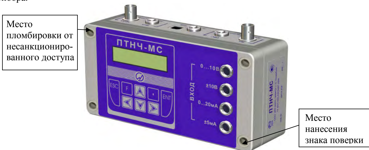
Рисунок 1 - Общий вид Приборов модификаций ПТНЧ-МС, место пломбировки от несанкционированного доступа и обозначение места нанесения знака поверки.

Общий вид приборов, место пломбировки от несанкционированного доступа и обозначение места нанесения знака поверки представлены на рисунках 1 - 3. Пломбирование комплектов осуществляется в виде пломбы в гнезде крепежного винта крепления крышки прибора.